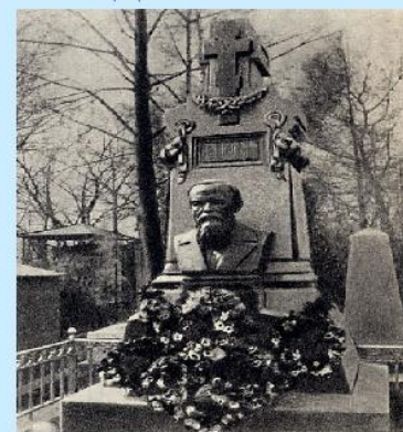
Бюст на могиле Ф.М.Достоевского

https://www.belta.by/culture/view/dose-dostoevskij-bessmerten-fakty-o-zhizni-i-tvorchestve-k-200-letiju-klassika-468935-2021/